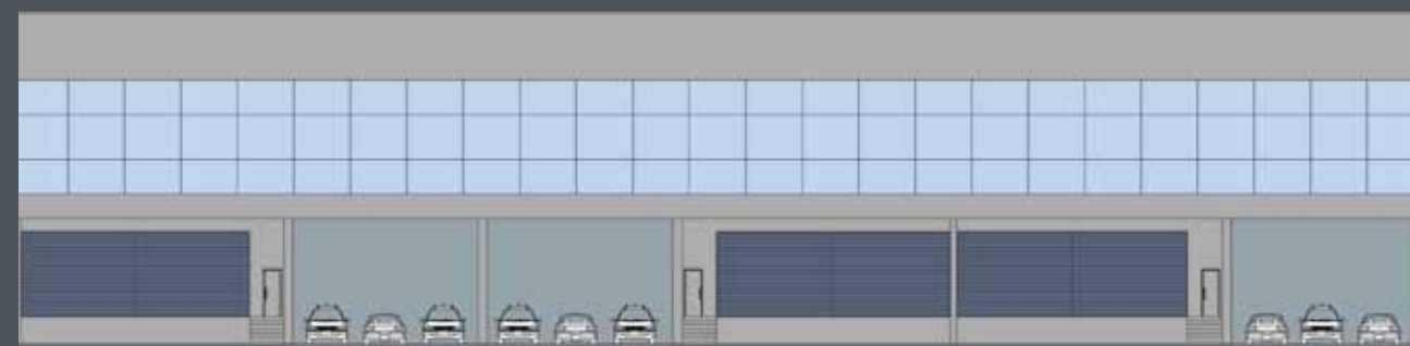
FACHADA GALPÃO TIPO 1