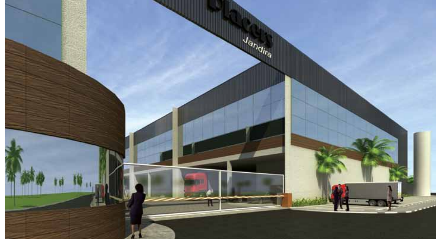
Perspectiva ilustrativa, sujeita a alteração.

O empreendimento The Placers acompanha a tendência de se localizar próximo aos grandes centros, mas afastado dos problemas das grandes cidades.