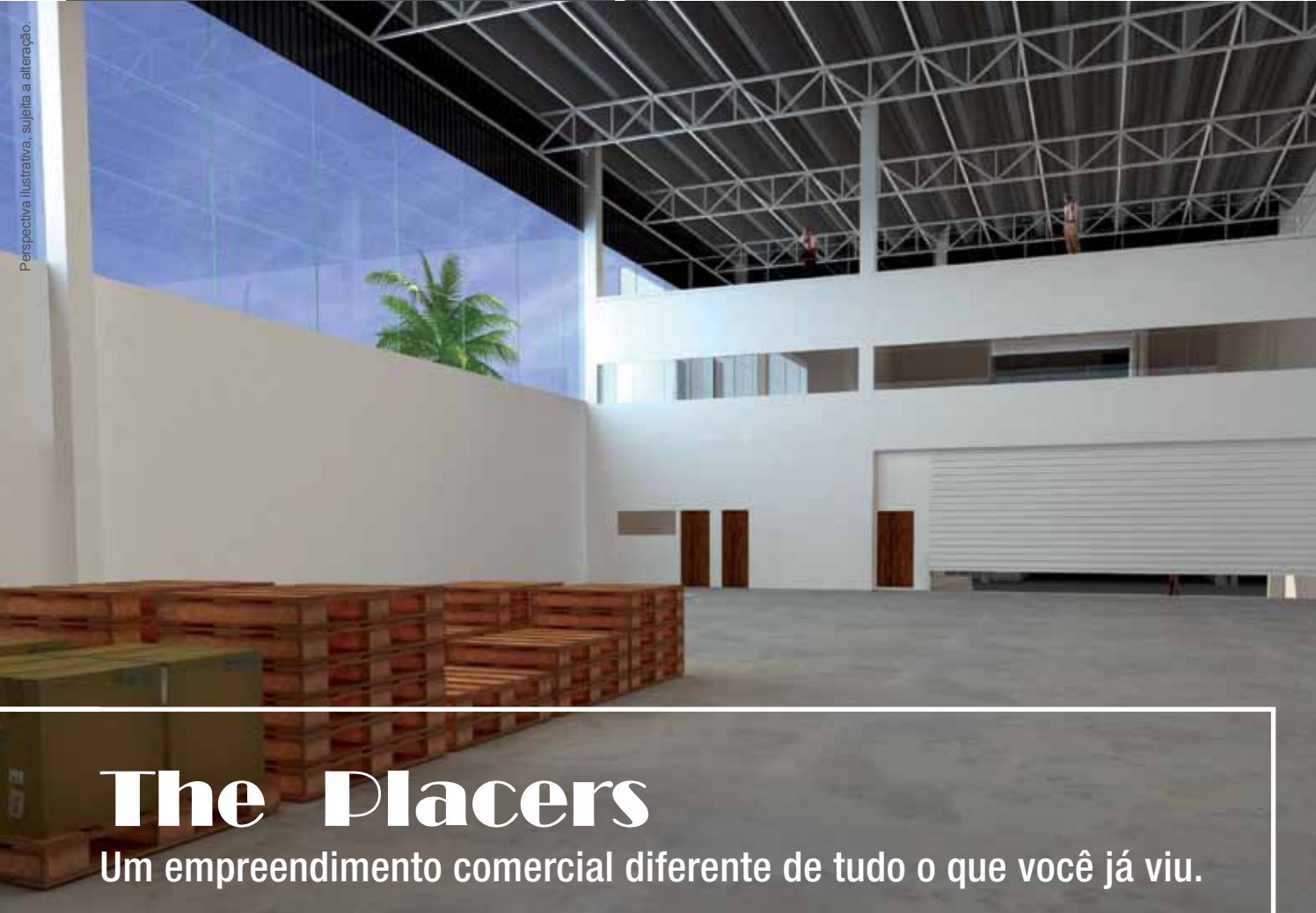
Perspectiva ilustrativa, sujeita a alteração.