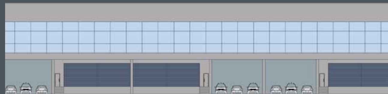
FACHADA GALPÃO TIPO 2